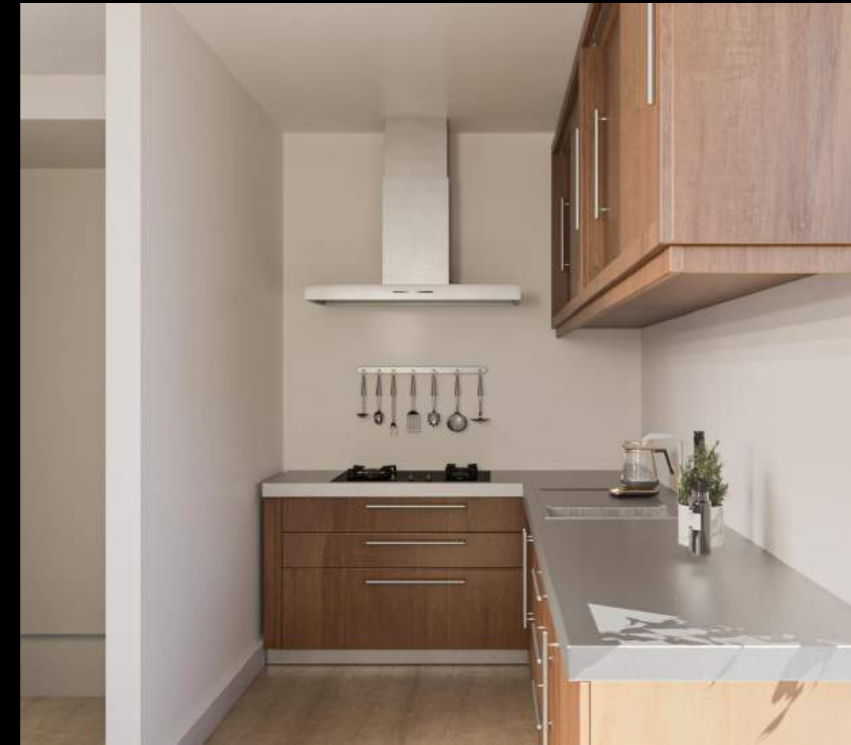
Render & Planimetrie